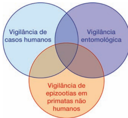
Figura 4 Esquema do atual modelo de vigilância epidemiológica da FA preconizado pelo Ministério da Saúde, incluindo a vigilância de epizootias em primatas não humanos (Portaria n° 5 da Secretaria de Vigilância em Saúde/Ministério da Saúde de 21/02/06, publicada no Documento Oficial União, Seção 1, n° 38 em 22/02/06) (SVOBODA, 2007).

Seção 1 - N° 38 de 22/02/2006). Este feito constituiu grande avanço não só para a vigilância epidemiológica da FA, mas também para outras zoonoses de interesse em saúde pública. Assim sendo, todas as notificações de epizootias devem ser sistematicamente investigadas e aquelas causadas por agentes etiológicos zoonóticos devem ser imediatamente notificadas aos serviços de saúde pública (Figura 4).