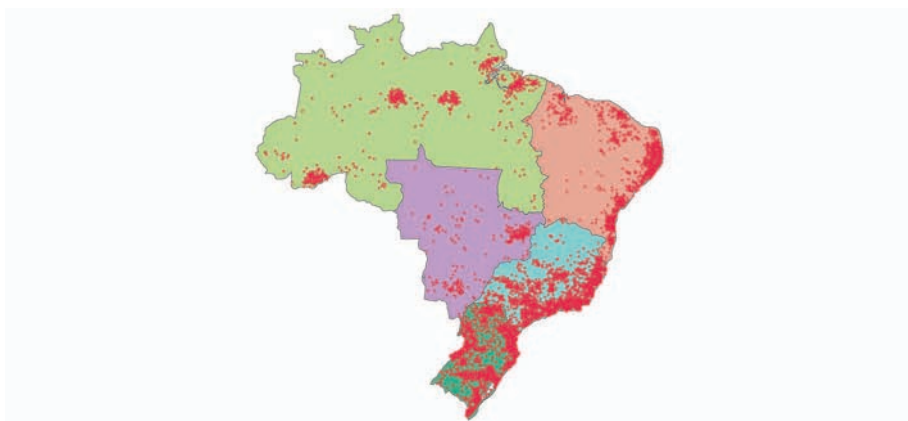
Figura 1 - Distribuição Geográfica da Leptospirose Humana, Brasil 2001 - 2007